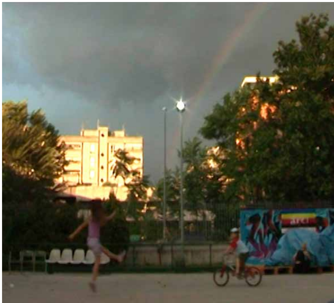
Un caso reale di verde pubblico. Il parco gestito dal comitato di quartiere.