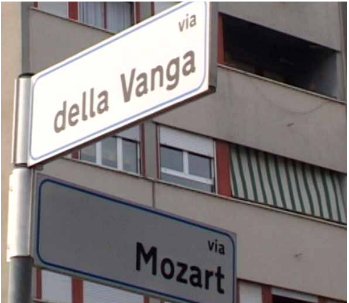
Dalla retorica fascista alla riqualificazione: Alle vie dedicate agli strumenti rurali si affiancano le nuove vie dei musicisti classici.

In Italy, approaches to planning similar to those embodied by MdA still seem to be limited to disused yet historic urban areas on the outskirts of city centres. Though confined to the edges, this planning approach may also contribute to consolidating and augmenting the interruptions, splits, and overall physical and social divides of Italian cities. MdA is performed and contained within its own carefully designed physical and stylistic boundaries. What remains to be seen is whether a site like MdA can be 'infused' with some of the same disruptive voices and organic layers that my colleagues from the UA and I idealistically attributed to Bologna's urban context.