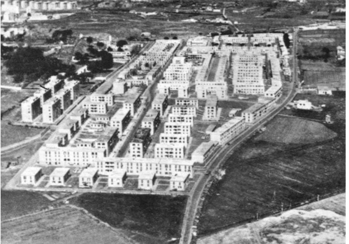
Una panoramica di Tiburtino Terzo e i suoi famosi "lotti", 1940 ca.