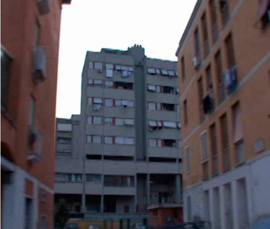
Uno scorcio contemporaneo dei nuovi palazzi sorti dopo le demolizioni.