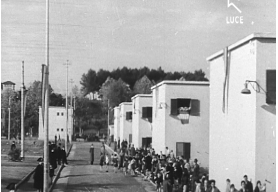
Parata per l'inaugurazione dei lotti, 1937.