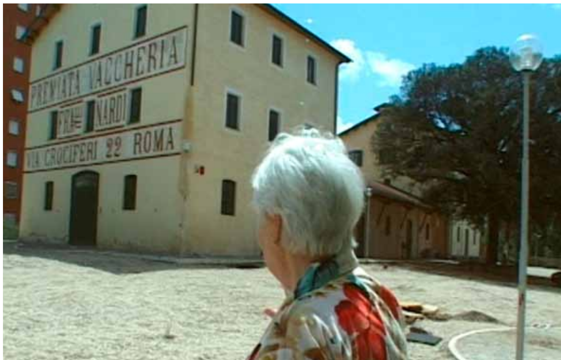
Riqualificazione urbana nel quartiere: La Vaccheria Nardi ora biblioteca comunale.