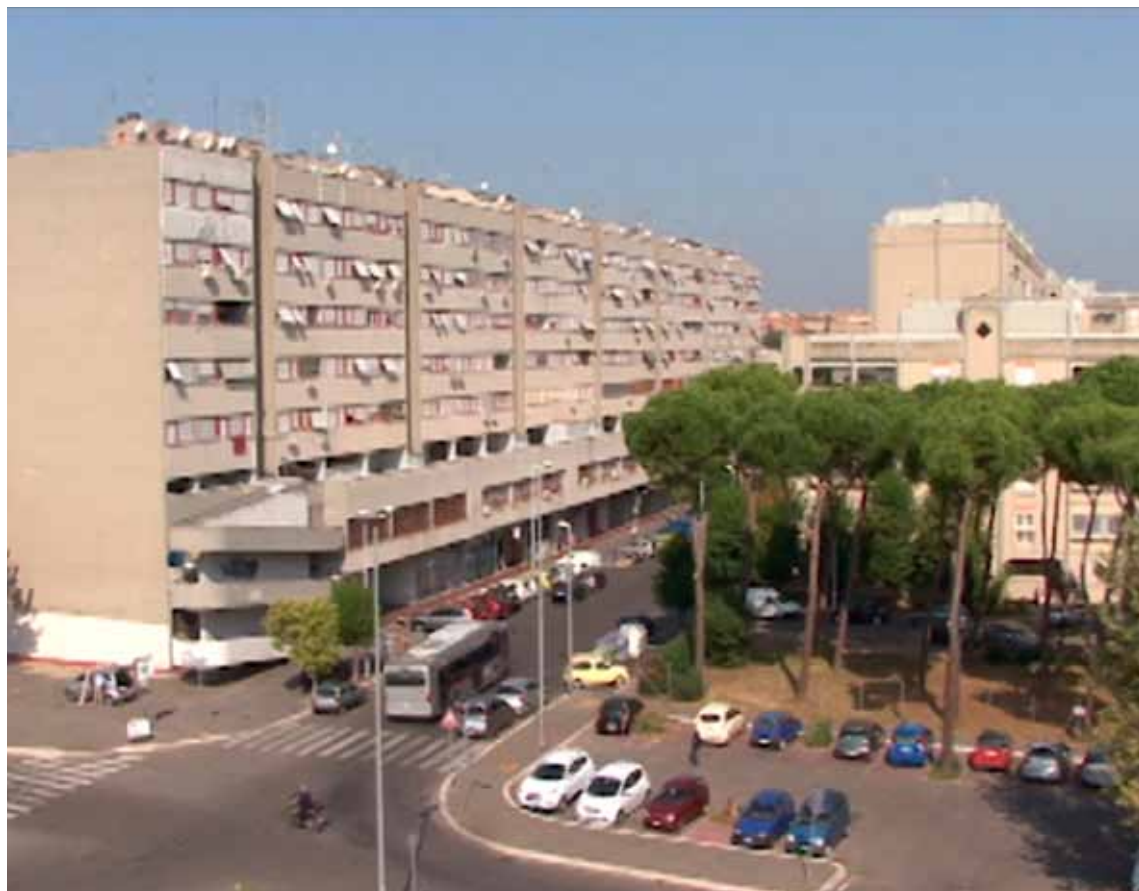
Tiburtino III come appare oggi.